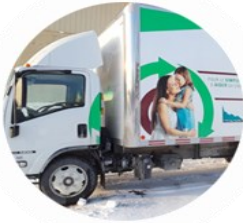
Liste des biens et matières acceptés pour le service de cueillette à domicile

La Ressourcerie Bellechasse offre un service gratuit de cueillette à domicile pour différents encombrants, pièces de mobilier et autres biens. Il est offert aux citoyens de 26 municipalités dont la liste est disponible sur Internet ( www.ressourceriebellechasse.com ).